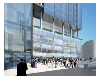
【西口国道デッキ2Fレベルより アーバン・コア、補助第18号線を望む】