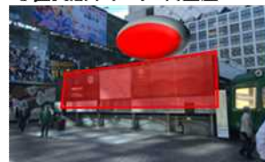
⑦ 百貨店前スペース